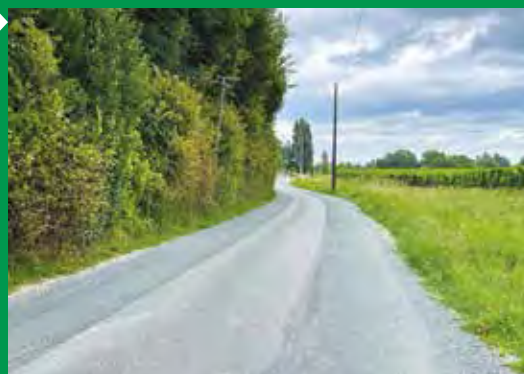
La réfection de la route de Toulouse.

Avec un budget prévisionnel estimé à 859 900 € en 2023, la voirie reste le premier poste budgétaire de la commune.